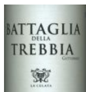
Battaglia della Trebbia Gutturmo Colli Piacentini DOC

Birre Cantinette Vino Cassette regalo Ceste Regalo Champagne Creme alla frutta Distillati di frutta Legumi Liquori Miele Olio e Aceto Pecorino di origine Toscana Portabottiglie Prodotti Cinta Senese Prodotti Lombardi Prodotti Umbri Salumi Spezie Spumanti Tartufi Tè Tea Forté Vino Zuppe Legumi